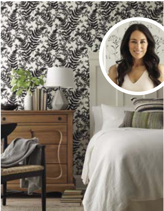
Обои из коллекции Magnolia Home 2

Одним из популярных направлений этого сезона стало стремление к природе — Greenery . Оно включает в себя природные оттенки и растительные дизайны, цветочные мотивы и натуральные фактуры, экологичные материалы и многое другое. Прекрасные примеры этой тенденции: коллекции обоев Magnolia Home от Джоанны Гейнс, популярной американской ведущей телешоу о преобразлении домов и обои из коллекции Midbec, передающие невероятные ощущения легкости и свежести утреннего леса.