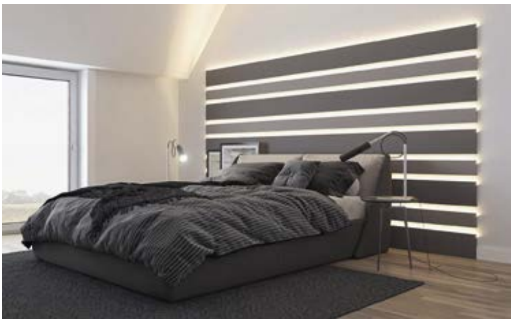
СВЕТОВЫЕ МОЛДИНГИ «ЕВРОПЛАСТ»

“ PITERRA ВСЕГДА ДВИЖЕТСЯ В РИТМЕ СВЕЖИХ ТРЕНДОВ, И ПРЕДСТАВЛЕННОЕ В НАШИХ САЛОНАХ РАЗНООБРАЗИЕ ВИДОВ ЛЕПНИНЫ — ЕЩЕ ОДНО ПОДТВЕРЖДЕНИЕ ЭТОМУ. ”