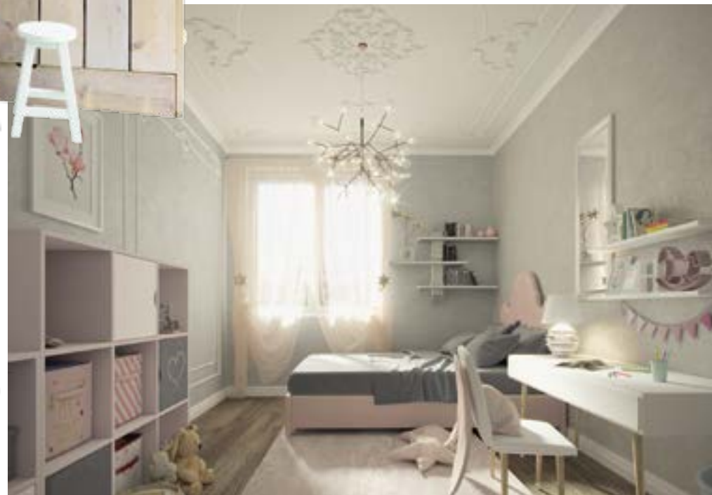
< КРАСКА «FLUGGER INTERIOR BLACKBOARD FINISH BLACK 77148» ДЛЯ ШКОЛЬНЫХ ДОСОК ЧЕРНАЯ (0,38Л)