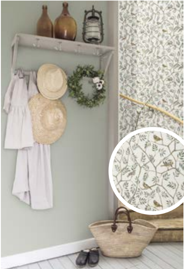
Обои из коллекции Midbec

И для кого уже давно не секрет, что в мире интерьерного дизайна, как и во множестве других динамично развивающихся сферах, существуют свои тренды и тенденции. Начало сезона всегда знаменует собой появление новых направлений или возвращение классики, впоследствии устанавливающее ориентиры для наиболее востребованных дизайнов. Piterra всегда формирует ассортимент, придерживаясь актуальных тенденций, с которыми мы и хотим вас познакомить поближе.