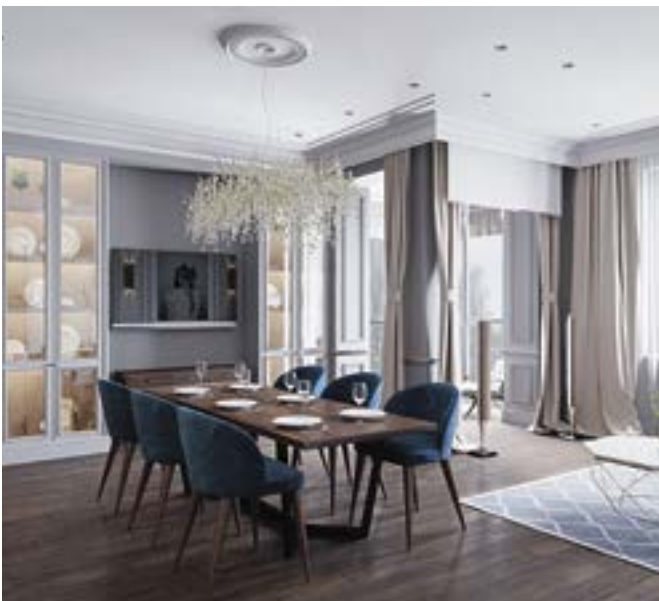
Фьюжн с элементами неоклассики, современного стиля и ар-деко в интерьере гостиной-столовой

“Я СОВЕТУЮ ВАМ СЛЕДИТЬ ЗА НОВЫМИ ТРЕНДАМИ, НО НЕ ГНАТЬСЯ ЗА НИМИ. ВЫБИРАЙТЕ ЭМОЦИОНАЛЬНО КОМФОРТНЫЕ СТИЛЬ И ПРЕДМЕТЫ ИНТЕРЬЕРА. ОЧЕНЬ ВАЖНО, ЧТОБЫ ИНТЕРЬЕР НРАВИЛСЯ ВАМ КАЖДЫЙ ДЕНЬ И НИ В КОЕМ СЛУЧАЕ НЕ НАДОЕДАЛ