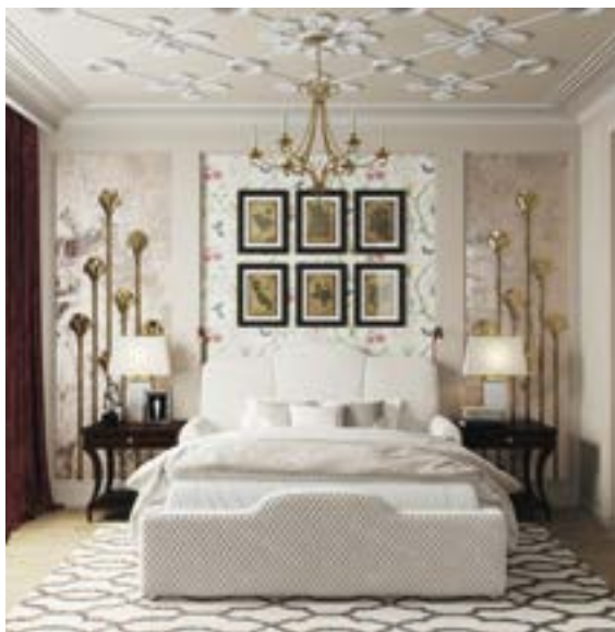
КОЛЛЕКЦИЯ «ЛЕГЕНДЫ АР-ДЕКО»

С неподдельной гордостью и любовью мы развиваем наш собственный бренд дизайнерского лепного декора RODECOR. Две коллекции — «Царскосельский Рококо» и «Легенды Ар-Деко» — являются лучшим примером наследственности стилей и того, как классические элементы вновь становятся актуальными. Тончайшие линии в дизайне розеток, необыкновенно изящные настенные зеркала — будучи в прошлом доступными лишь царской семье и высшему свету, проделали долгий путь для того, чтобы стать современным инструментом оформления, который теперь представлен в коллекции «Царскосельский Рококо». Геометрические композиции с четкими линиями, взявшие свое начало с роскошных трансатлантических лайнеров первой половины XX века, с помощью коллекции «Легенды Ар-Деко», перенеслись из, по сути, общественных пространств в личные.