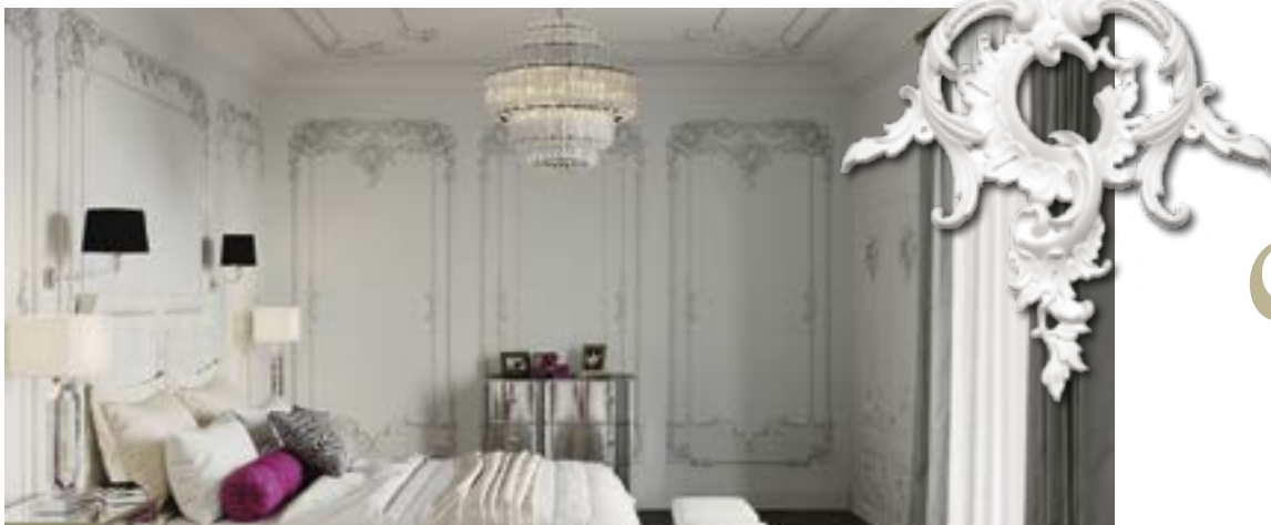
ЛЕПНОЙ ДЕКОР «RODECOR» ИЗ КОЛЛЕКЦИИ «ЦАРСКОСЕЛЬСКИЙ РОКОКО»