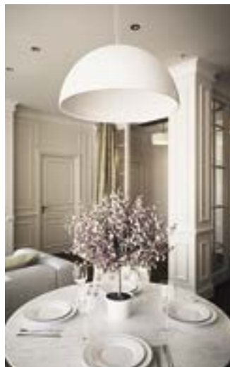
Дизайн-проект столовой-гостиной в стиле американская классика со светлыми окрашенными стенами, декоративными молдингами