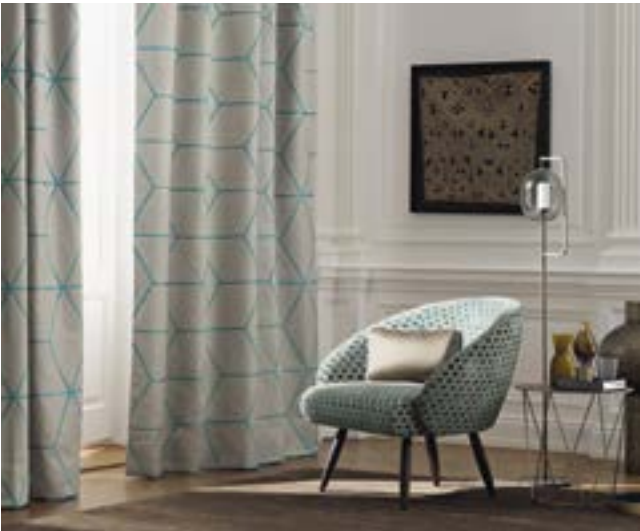
Текстиль из коллекции Zimmer&Rohde

Геометрические принты всегда широко используются в интерьерном дизайне, и сезон 2018 года не стал исключением. Дизайны для любителей строгих акцентов не теряют своей актуальности, обогащая оформляемые пространства четкими линиями, размеренными повторениями и математической выверенностью. Говоря о геометрии, рекомендуем присмотреться к коллекции «Легенды Ар-Деко» нашего бренда дизайнерского лепного декора RODECOR, завораживающей красотой линий и возможностями создания изысканных узоров. Коллекция тканей Destinations от Zimmer&Rohde также придется по вкусу любителям геометрии: дизайны впечатляют своей комбинацией выверенности, тонкости красочных линий и их глубины, создающей эффект, подобный граням бриллианта.