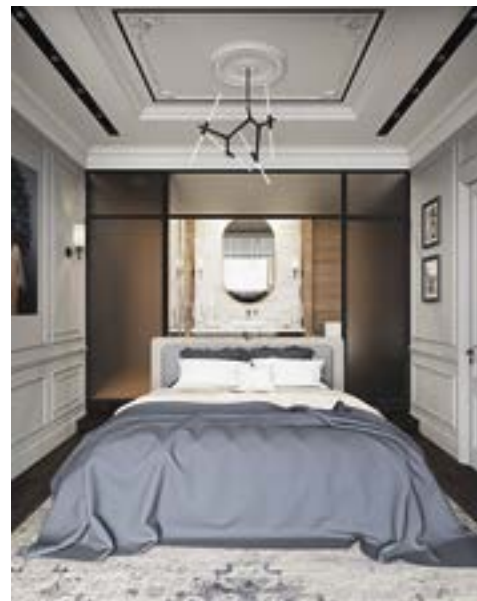
Мастер-спальня, за которой размещена ванная комната со стеклянной перегородкой