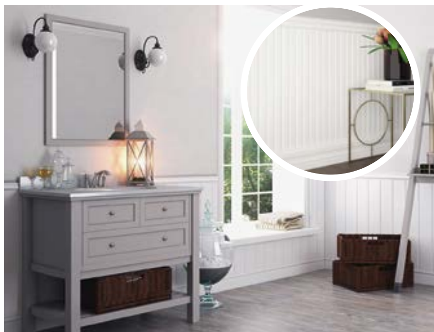
СТЕНОВЫЕ ПАНЕЛИ «ULTRAWOOD» ИЗ ЛДФ-ДЕКОРА

Еще один вариант для поклонников американского стиля — Ultrawood. ЛДФ-декор, в составе которого присутствуют натуральные смолы и древесное волокно, является прекрасным аналогом деревянного декора. В отличие от настоящей древесины, Ultrawood неприхотлив в эксплуатации, может использоваться во влажных помещениях, да и в целом с ним проще работать. А стеновые панели Wain в американском стиле дают роскошный результат при своей демократичной цене.