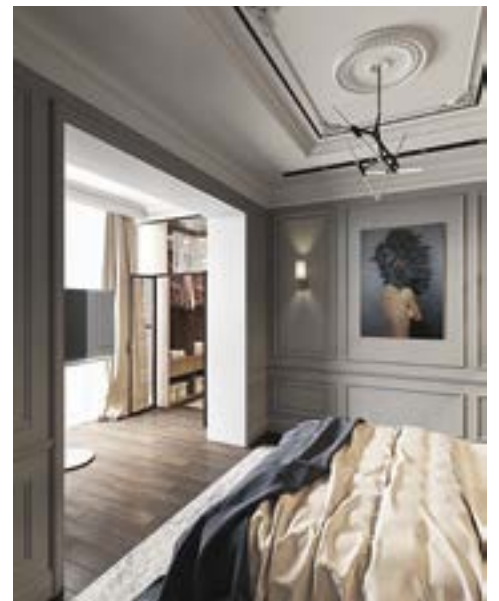
Вид из спальни на гардеробную комнату, размещенную на лоджии