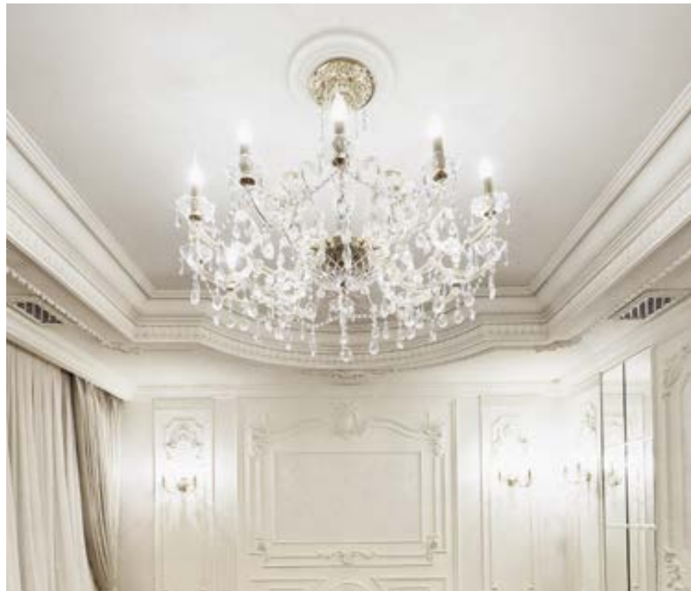
ПЛАСТИЧНЫЙ ГИПС «PEARLWORKS»

Еще один вариант для поклонников американского стиля — Ultrawood. ЛДФ-декор, в составе которого присутствуют натуральные смолы и древесное волокно, является прекрасным аналогом деревянного декора. В отличие от настоящей древесины, Ultrawood неприхотлив в эксплуатации, может использоваться во влажных помещениях, да и в целом с ним проще работать. А стеновые панели Wain в американском стиле дают роскошный результат при своей демократичной цене.