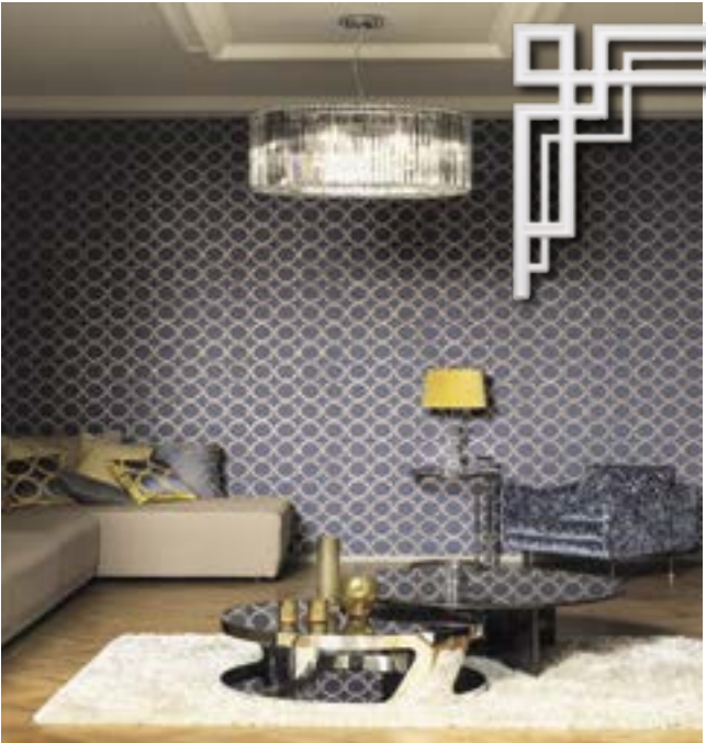
Обои из коллекции Casadeco Элемент лепного декора из коллекции «Легенды Ар-Деко»

Большую популярность набирает применение металлизированных и оформленных под металл покрытий. Глянцевый блеск металла при грамотном использовании элементов декора сделает облик пространства ультрамодным и одновременно утонченным. Обратите внимание на Edison от Casadeco — коллекцию ультрасовременных настенных покрытий с завораживающими яркими геометрическими дизайнами, 3D-эффектами и насыщенной металлизированной палитрой в оттенках золота, серебра, меди и жемчуга.